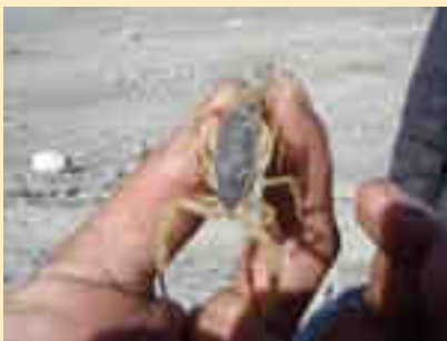
Primer pla d'un escorpí

Continuant amb la nostra política de fer que el grup de treballadors es trobin tan confortables com sigui possible, després d'una reunió vàrem repartir a cada obrer uns equips bàsics de primers auxilis. A l'esmentada reunió se'ls va fer saber que acceptàvem una assenyada proposta seva per fer jornada intensiva, de 08:00 a 14:00. Treballen cada dia una hora menys, però ho fan amb més intensitat que abans. L'anterior pausa de l'àpat, amb una hora per dinar, trencava la jornada en dos i dificultava el desplaçament d'aquells treballadors que viuen més lluny de l'obra, a més de fer més feixuga la seva reincorporació després de menjar a corre-cuita.