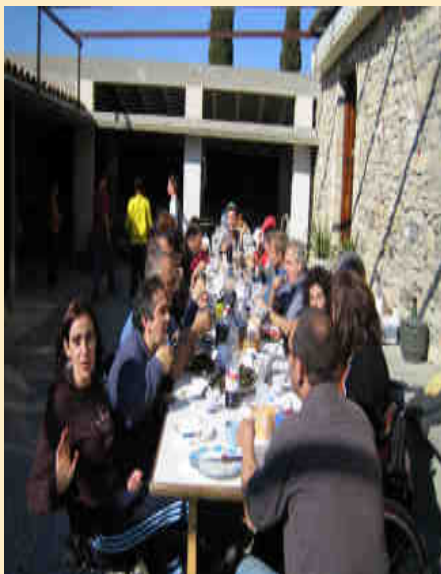
En un moment de la calçotada

Malgrat tot, tal i com està passant a altres entitats, als socis històrics els va sorprendre l'evolució del nombre de socis i voluntaris durant els últims anys. Ho varen atribuir al canvi d'hàbits de la societat en general i van fer una crida a la participació.