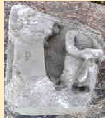
Primera escultura desoberta al jaciment arqueològic