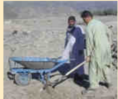
Després de la formació l'equip ja treballa sobre el terreny

El treball a l'excavació continua imparable. Les estructures es van despellant a un ritme sorprenent i constatem que estem creant un potent equip d'especialistes auxiliars d'arqueologia, un aspecte que hem de tenir molt present a l'hora d'avaluar al final tot el projecte, en el cas que hi hagi possibilitats i voluntat de donar continuïtat amb excavacions properes, la creació d'un petit museu provincial o un equip de restauració. Hem trobat la primera escultura. Es tracta d'una figura antropomòrfica, amb el cap seccionat i que sembla portar una safata. A la seva dreta hi ha una columna amb un capitell. Tot té una clara influència grecorromana, un dels trets distintius de l'art gandharià. Té una polsera al canyell de la dreta i vesteix una túnica. Es tracta d'un home, ben bé amb tota seguretat un monjo budista, i podria representar la vida quotidiana al monestir o un episodi de la vida de Buda o algun dels seus deixebles. De moment, la tenim ben protegida i el seu destí depèn hores d'ara del que decidim en el proper contracte de col·laboració que hem de signar amb el Ministeri de Cultura afganès quan acabem amb la feina de detecció de murs.