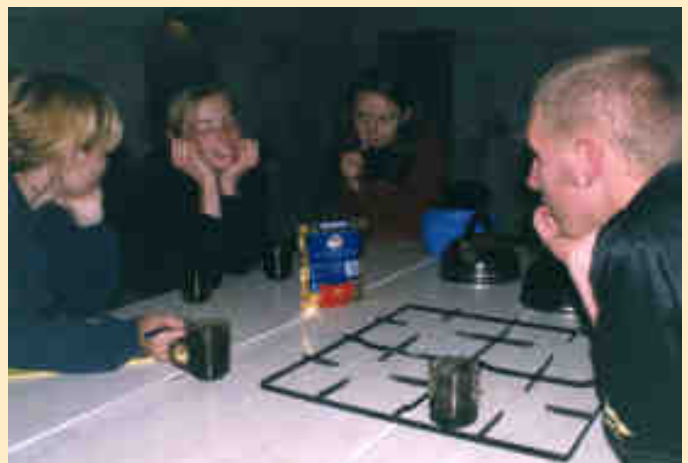
Un grup de voluntaris a un camp de treball a Polònia

Ryszard Kapuscinsky (Pinsk 1932 – Varsòvia 2007) és ja una de les grans figures del periodisme del segle XX i també un gran humanista. L'escriptor va morir el passat mes de gener deixant com a llegat obres com Èban (2000) o El Imperi (1994), dues perles més que recomanables a tots aquells que vulguin deixar-se inspirar pel seu esperit humanista i curiós. A Èban el periodista es va apropar a la cultura aficana sense prejudicis i lluny de les mirades típicament europees. Al llarg de la seva vida es va preocupar pels sectors més desfavorits i es va mantenir independent en front a pressions de qualsevol tipus que van intentar tergiversar el seu missatge. Això va fer que guanyés el Premi Príncep d'Astúries de Comunicació i Humanitats 2003.