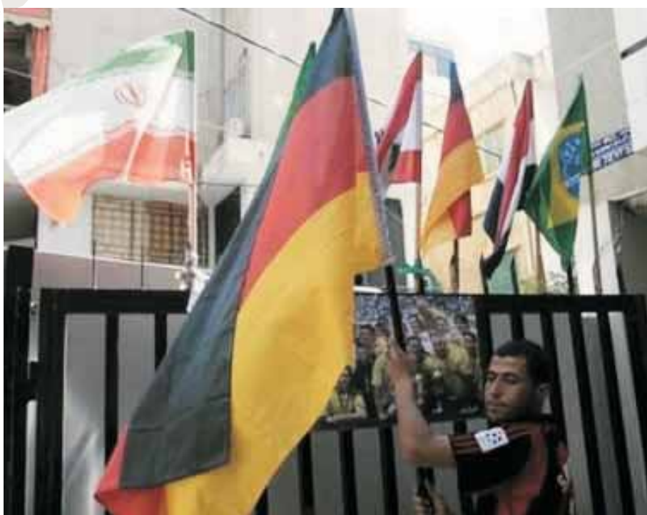
Banderes del Mundial a Beirut