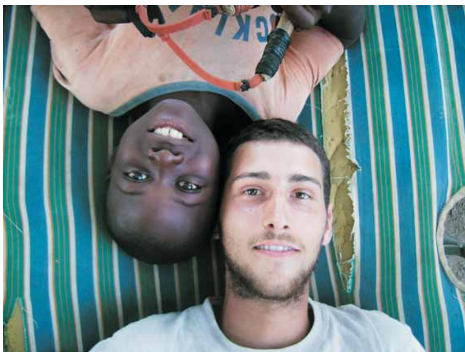
Burkina Faso, Oriol Veciana